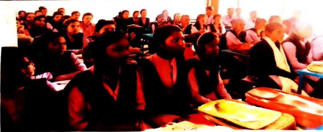
कार्यक्रम के फोटोग्राफ्स