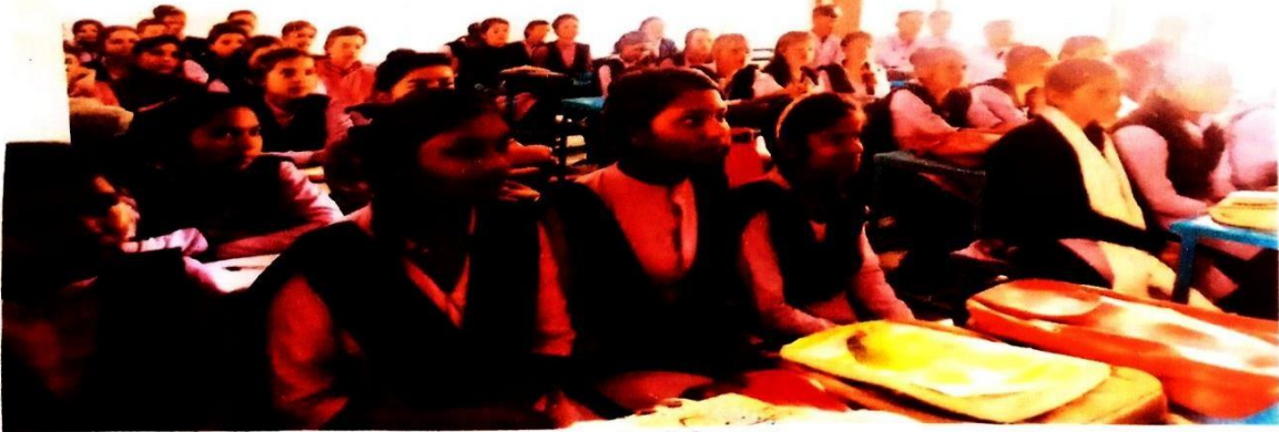
कार्यक्रम के फोटोग्राफ्स